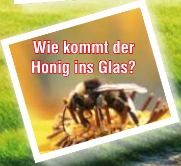
Wie kommt der Honig ins Glas?