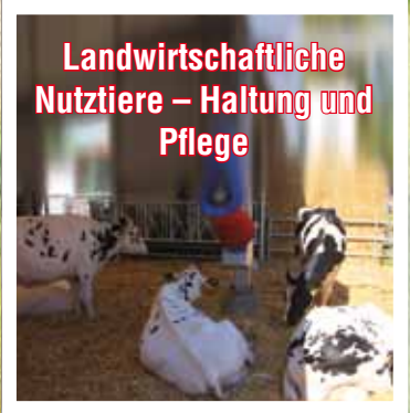
Landwirtschaftliche Nutztiere – Haltung und Pflege