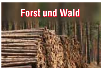
Forst und Wald