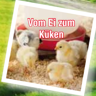
Vom Ei zum Küken