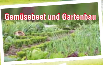
Gemüsebeet und Gartenbau