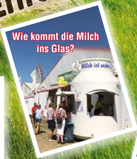
Wie kommt die Milch ins Glas?