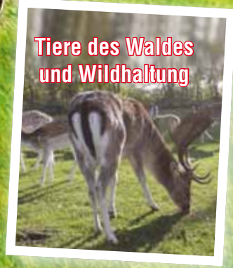
Tiere des Waldes und Wildhaltung