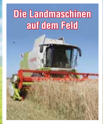
Die Landmaschinen auf dem Feld